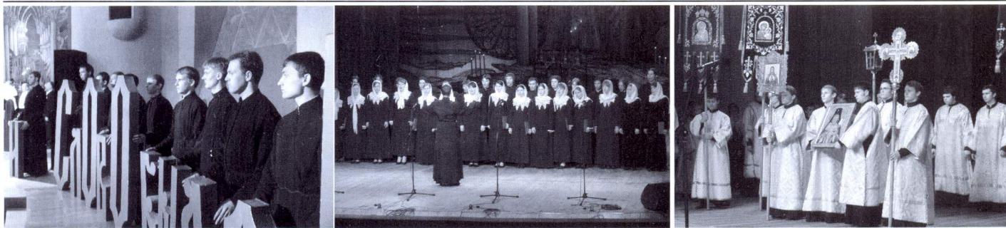
Празднование Дня Славянской письменности и культуры

Материал подготовили: Т. В. Дорофеева, В. Копылов, М. Цуканов.