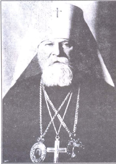
Митрополит Крутицкий и Коломенский Николай (Ярушевич)

И когда Сам Носитель истины пришел в мир, «мир Его не познал. Пришел к своим, и свои Его не приняли» (Ин. 1:10-11). Истину Божию ругали, осмеивали, предали мукам, пригвоздили ко кресту и погребли во гробе. Разве это не казалось полным торжеством лжи и преступных заблуждений? Но воскрес Христос! И истина Божия воссияла своим пол-