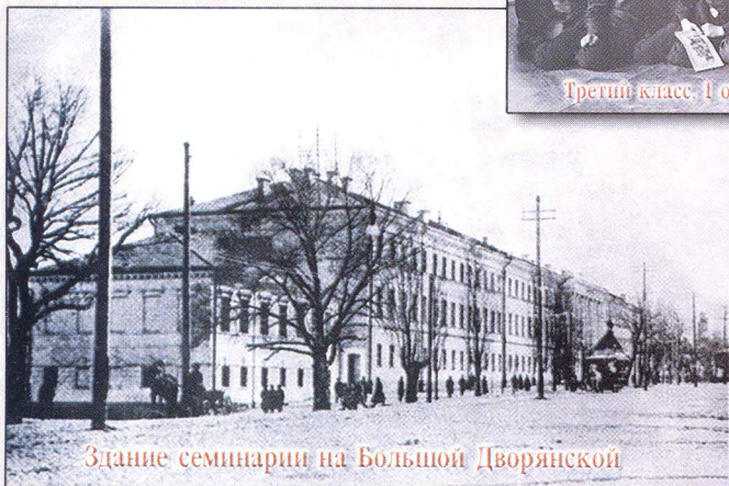
Здание семинарии на Большой Дворянской