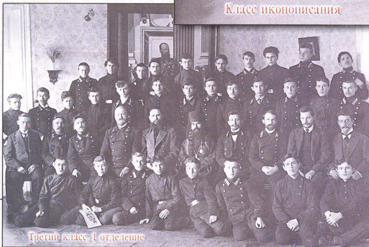
Третий класс, I отделение